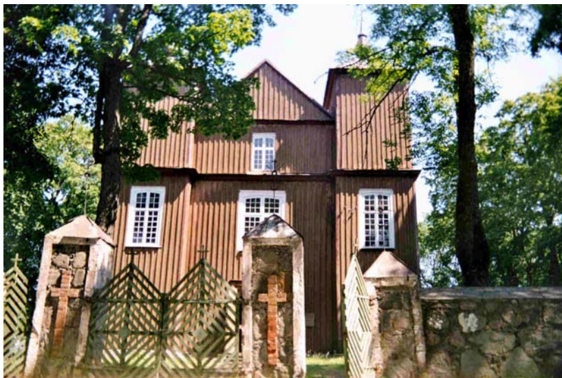
kościół w Hanuszyszkach – lipiec 2002 r.